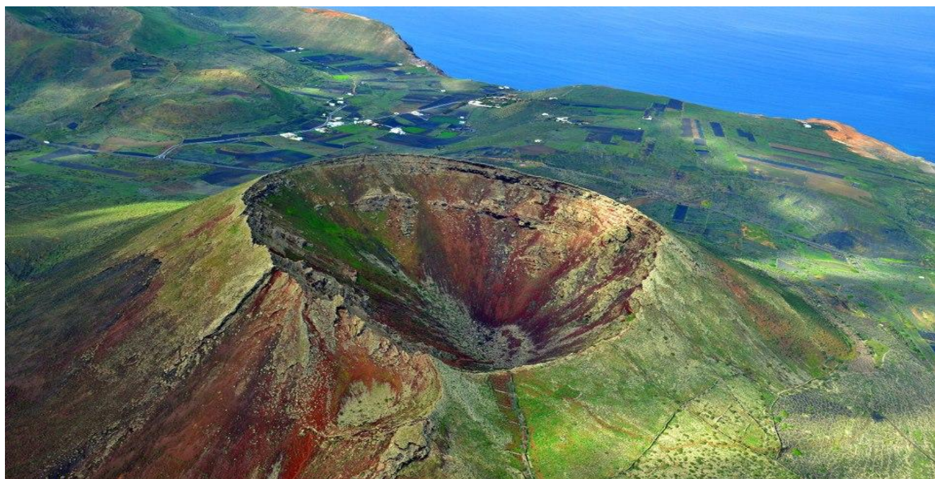
Volcán de La Corona

Otras especies que se encuentran presentes en todo el recorrido son el erizo moruno ( Atelerix algirus ), el perenquén ( Tarentola angustimentalis ) o el lagarto de Haría ( Gallotia atlántica ), así como el conejo ( Oryctolagus cuniculus ).