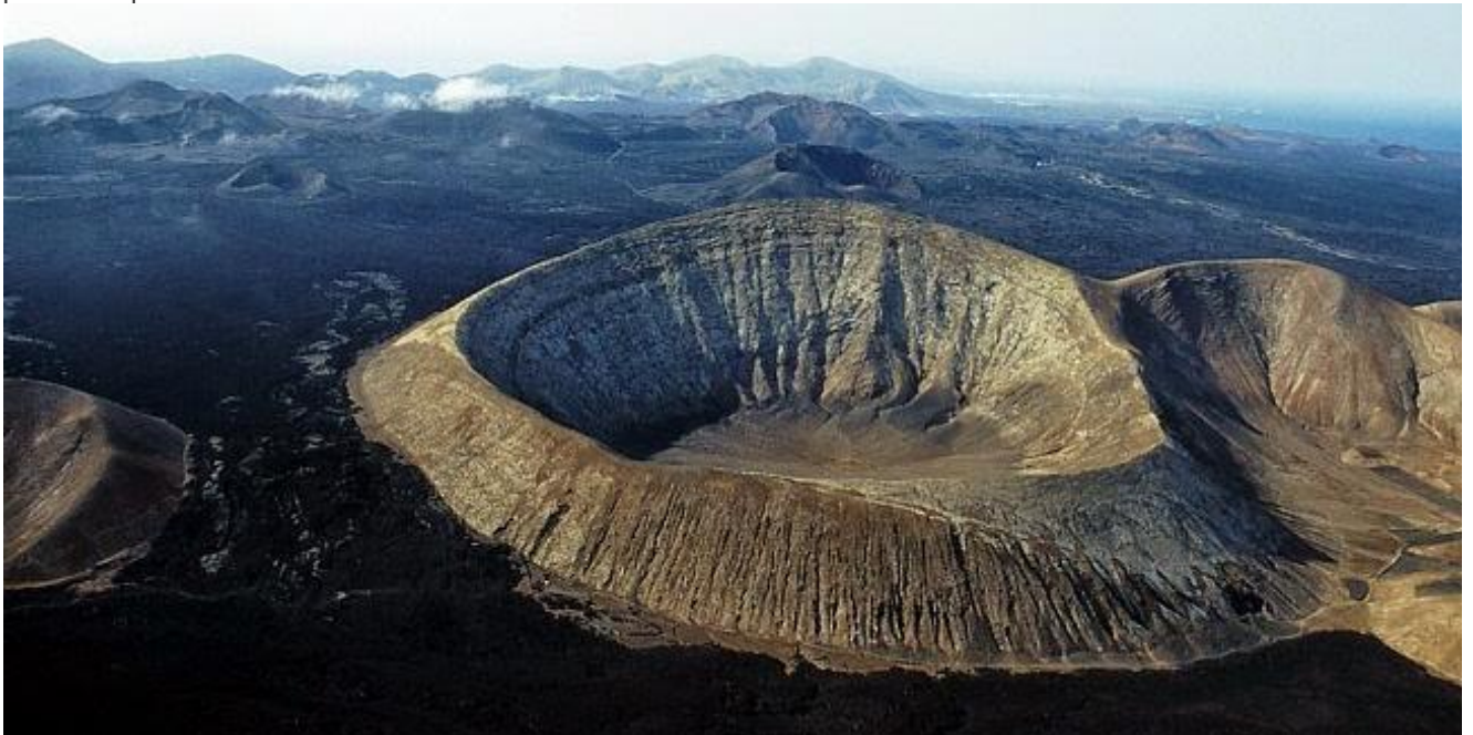
Volcán Caldera Blanca