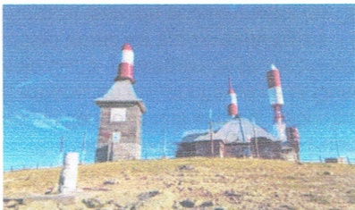
La Bola del Mundo