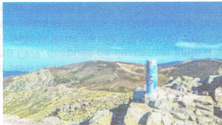
Cumbre La Maliciosa

Regreso en Tren a las 19:00 horas, Hotel cena y a dormir.